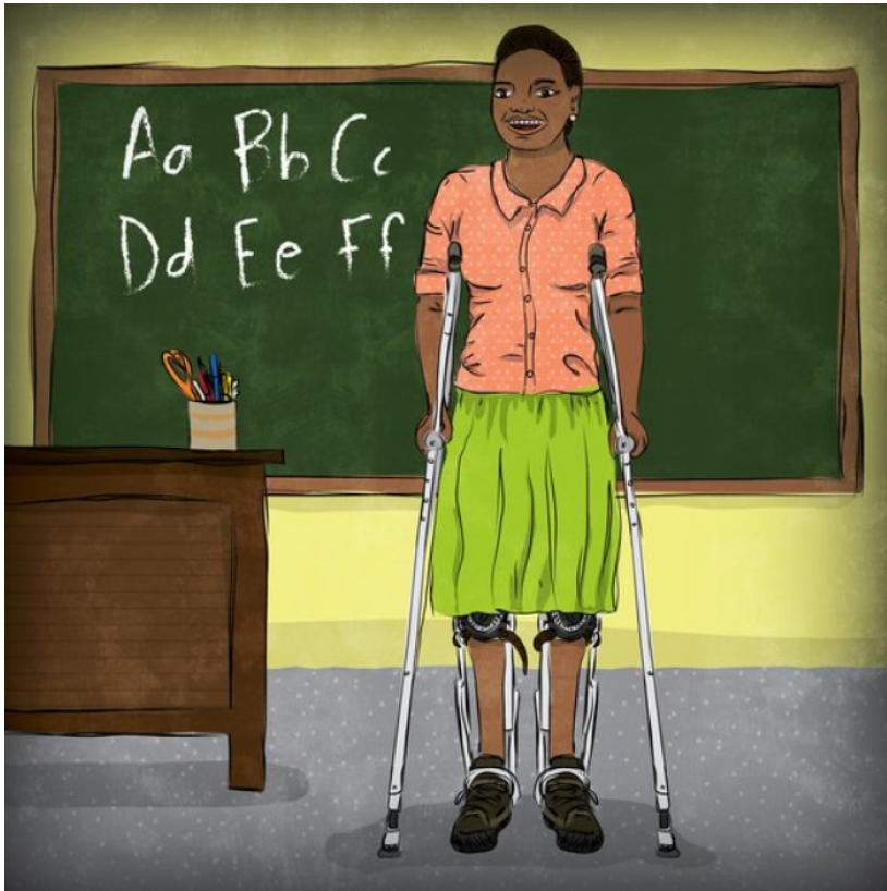
Agnes kinentiá muletas iga nejnemi.