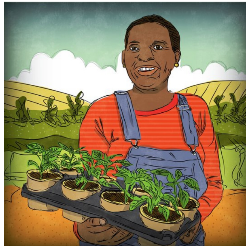
Novecınaj itoká' Moira.