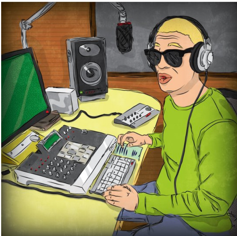
Yéj ayekti iyix, awel ye'tachá.