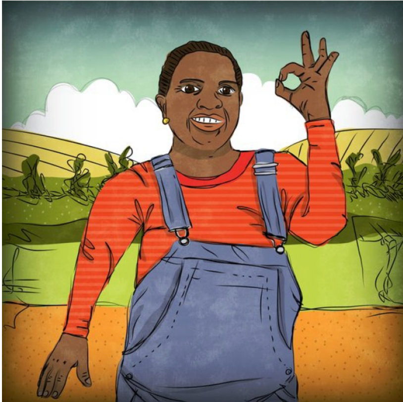
Moira ayá' takaki.

Yéj kua' tajtowa kinex̄tiapa iga ima' iga manesi tē kijtowa.