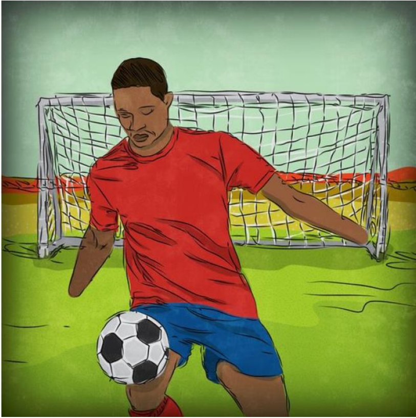
Oscar ma te pon.

E' yéj kakiá komati goles, w an yéj de noe q ipoj.